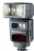
Blitz FPF 54 Mit Motorzoom und TTL-Belichtungssteuerung, speziell für die FinePix S3 Pro, Leitzahl 54