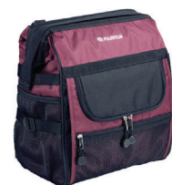
Rucksack RS Schützt zuverlässig Kamera und Zubehör. Mit Ordnungssystem für optimalen Überblick.